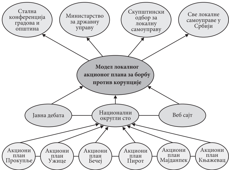
2. Графички приказ методологије израде Модела локалног акционог плана за борбу против корупције.